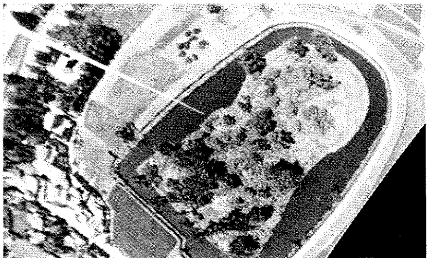
風から撮った埼玉県・二子山古墳(室岡克孝著「カイトフォトグラフィー」より P.7参照)

2月8日(土)の第2回定例フォーラムでは、青年会議所が中心となって設立した船橋市と真岡市の2つの基金について事例報告が行われる予定である。