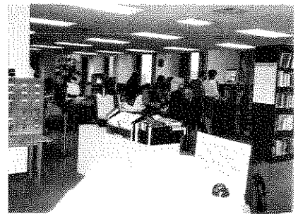
アメリカの財団センターの閲覧室 (昨年移転したがこの写真は移転前のもの)

て運営するが、将来は基金をもった法人となることが目標とされている。運営費の確保についてはかなりの困難もあるようだが、ともかく何らかの形でスタートすべきではないかというのが調査の結論と言えよう。トヨタ財団としても、この設立に向けての積極的に関与する方針が先の理事会で確認された。(久須美・記)