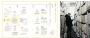
社会教育をひっぱる公民館の歴史から生活改善やコミュ ニティデザインにつながる瞬間をわかりやすくご紹介。

公民館・図書館や学校のルーツを探 る!?!/社会教育法とは!?!/公民館と公民 館的なもの学習マンガ「公民館探偵・ニ シヤマがいく!?!」など