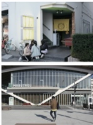
共同売店 [沖縄県内各地] など