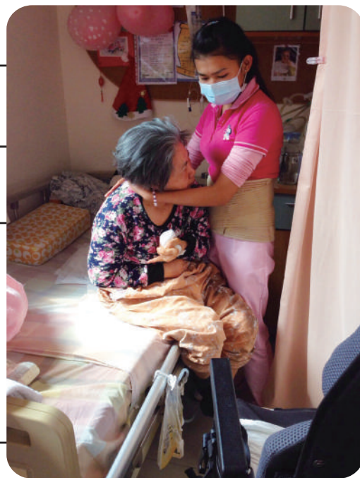
台湾で介護に従事するインドネシア人労働者