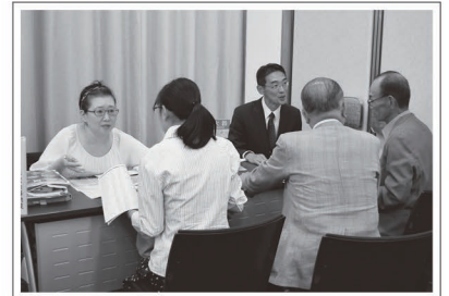
2014年度 助成団体合同説明会 個別質問会