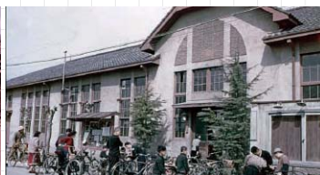
倉敷市所蔵「内田鎌太郎氏寄贈フィルム」--- 中国銀行倉敷駅前支店 / 現市立美術館南方面 / 旭町時代の旧倉敷市役所