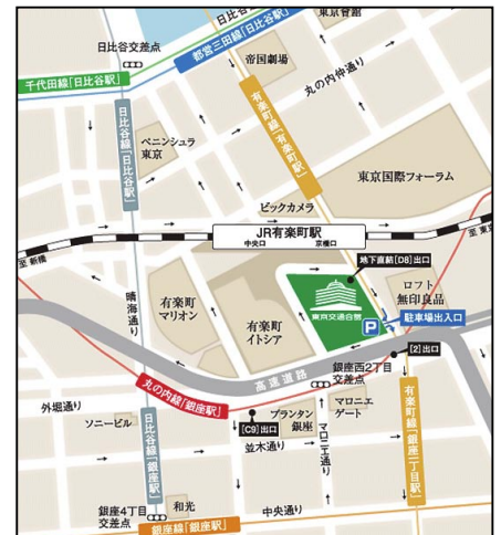
LEAGUE 有楽町 東京交通会館 6F