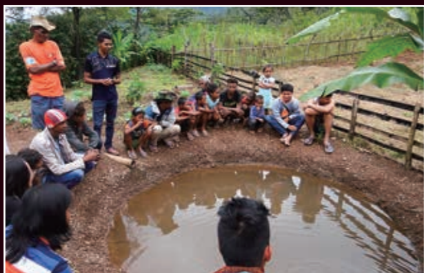
マイケル（右から2番目）の話に耳を傾ける