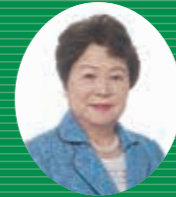
公益財団法人 トヨタ財団理事長 遠山 敦子

憶に新しいところ。今後も非営利活動は清新な活力を日本社会に吹き込み続けることでしょう。