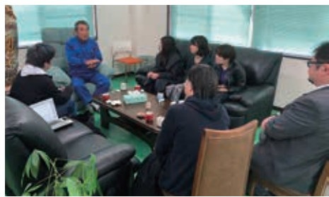
ヒアリング調査の風景

このような鹿児島の国際化や、梶田孝道らが指摘した（2005年）、外国人労働者が存在しつづつ社会生活を欠いているがゆえに