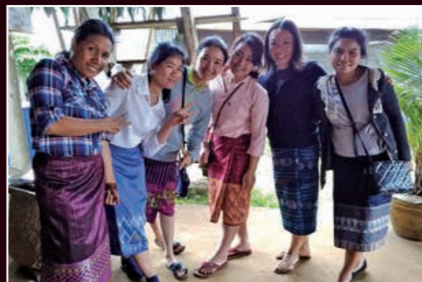
ラオスと東ティモールのメンバーたちと（右から2番目が筆者）