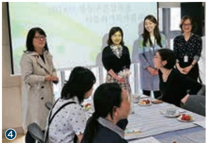
①移住者と連帯する全国ネットワーク。②韓国のミャンマー・コミュニティのシェルター・お寺にて。③日本視察訪問プログラムにて日本側のベトナムメンバーが韓国側のベトナムメンバーを歓迎する様子。④韓国の多文化家族支援センターにて

一方、日本と韓国では、移民・外国人の統合や共生なるものは、入国した外国人が地域住民（国民）とコンフリクトなく暮らすことによって成立するとの認識が強く、そのコンフリクトは、「生活」のなかでホスト社会の言語を学びホスト社会と外国人がお互いの文化を体験することで解消されうると捉えています。その結果、移民・外国人が就労・教育欠如により不利な状況、不安定な労働におかれやすいという現実が軽視されがちです。