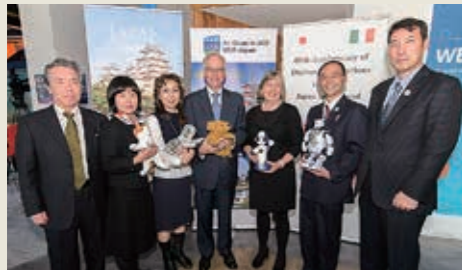
日本・アイルランド外交関係樹立60周年を記念して開催したUCD Japan Fair 2017「介護ロボット」セミナー。ダブリン、アイルランド銀行のコミュニティスペースにて