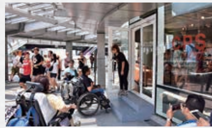
車椅子利用が困難な段差

●発行/編集：特定非営利活動法人まつどNPO協議会・特定非営利活動法人CRファクトリー ●お問合せ：特定非営利活動法人CRファクトリー 〒1084-0014 東京都港区芝4-74-1 西山ビル4階