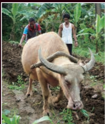
ネグロスの伝統的な「トラクター」の使い方を教わる東ティモールのメンバー