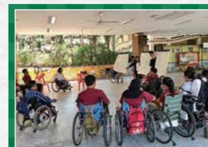
【国際助成プログラム】 「インクルーシブ社会を目指すアジアの障害者リーダーの交流」in タイ

民へのサポートが十分ではないといった課題について述べられ、実際に中国から技能実習生として来日した方からも発表があり、外国住民の視点からどのような事が問題