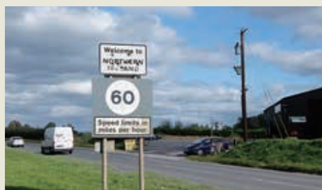
アイルランド(キャヴァン県)から北アイルランド(ファマナ県)に入る国境。国境といっても変化といえれば、制限時速がキロ表示からマイルに変わるくらいで気が付かない人も多いほどだ。EU離脱後にはどうなるのか不安を語る人もいる

テクノロジをどのように生み出し、どのように導入すれば、利用者との共生ができるのか、プライバシーなどの倫理的問題や安全を含むリスクの側面をどう担保するのか、ということもとても大切な視点である。グローバルとローカル、そして、先端技術と人間社会が、対峙するのではなく、共存し、共創し始めるような環境づくりに必要な資源やスキルとは何かを、介護ロボットを通じて、皆さんと一緒に考えてみたいと思っている。