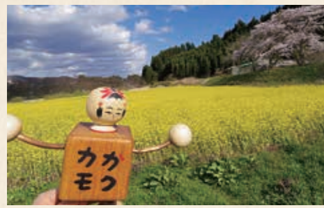
菜の花畑とこけし