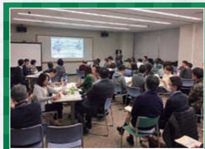
【国内助成プログラム】 「鹿児島の多文化共生基礎調査～在留外国人も共に主体となる地域づくりへ～」報告会+ワークショップ

2 019年3月9日、かごしま県民交流センターにて「鹿児島の多文化共生基礎調査」在留外国人も主体となる地域づくりへ」報告会+ワークショップが開催されました。主催は鹿児島多文化共生推進ネットワークで、トヨタ財団では「しらべる助成」の枠組みで助成を行っております。 在 留外国人(特に外国人技能実習生)を取り巻く課題を解決するプラットフォーム構築を通じて、彼ら・彼女らが鹿児島の持