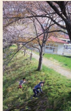
思いっきり遊びたくなる春

宮城県鳴子温泉にリターンし、間もなく丸4年が過ぎようとしています。当通信も、今回で11回目を迎えました。1回目（J-O-I-N-T 20号）を読み返すと、私の暮らす鳴子温泉地域の当時の人口は6633人。その後、予定通り(?)人口が減り続け、現在は5949人(2019年3月現在)、2030年には3700人台になると予測されています。3月末には、近所の診療所が先生の高齢を理由に幕を閉じました。いま、地方では「いつかはそうなるだろう」と思っていたことが次々に現実となっています。世間では「2040年問題」がささやかれています。