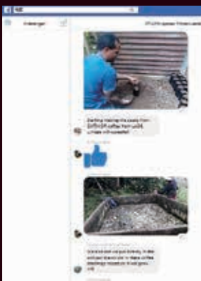
プロジェクト後もSNSで連絡を取り合うメンバーたち

3か国の参加メンバーたちも、徐々に関係性を築いて友人になり、互いのことを気遣ったり、忌憚なく意見があったりするところができるようになっていった。そのことは参加者一人ひとりが農業技術などの具体的な学びを深めることに大きく役立ったと確信している。