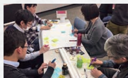
ワークショップの様子

続可能な地域づくりを担う1人の住民として包摂され、主体性を発揮できる地域の形成を目的として調査が行われ、報告会には、NPOや行政、国際交流協会の方々が参加されました。鹿児島において外国住民の日常生活におけるトラブルは、地域でのゴミ出し問題が多く、それは外国住民へ自治体や行政からの情報が届いていない背景があると述べられていました。また、ゴミ出しを通じて、地域の外国人とコミュニケーションを図っていくとする動きがある自治体も出てきていると報告がありました。 そ の他には、事例発表として鹿児島県出水市の職員の方から、外国住民をとりまく問題の説明や、行政では観光で訪れる外国人へのサポートは多くなされるが、外国住民へのサポート